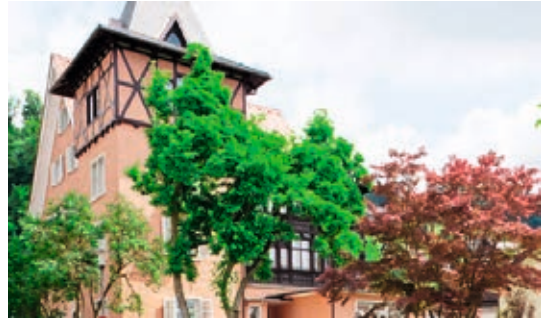
↓ Zanzenberggasse, Dornbirn