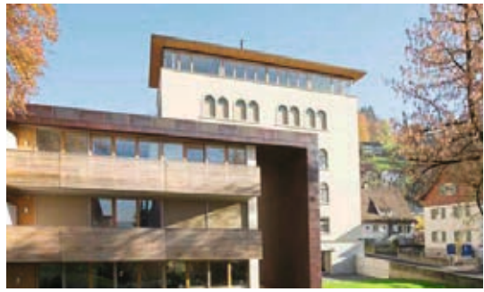
↑ Magazin Oberdorf, Dornbirn