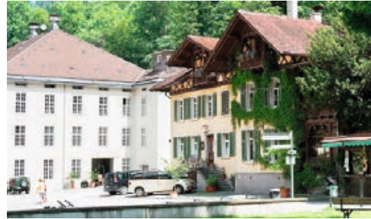
↓ Gütle, Dornbirn