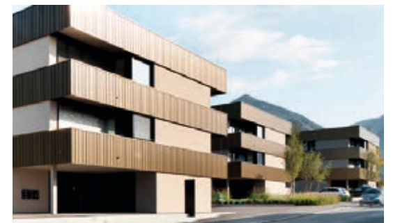
↑ Quartier Bündtlitten, Dornbirn