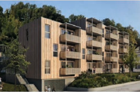
↓ Müllerstraße, Dornbirn