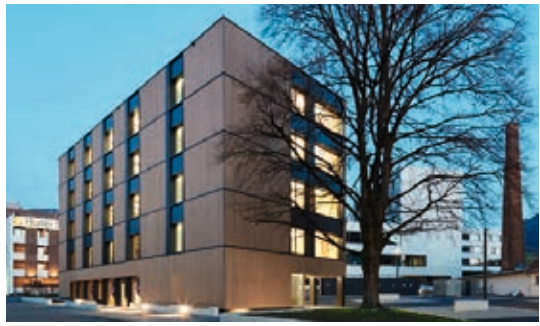
↑ Sägen, Dornbirn