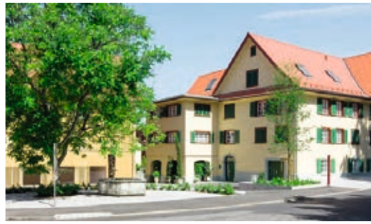
↑ Kirchgasse, Dornbirn