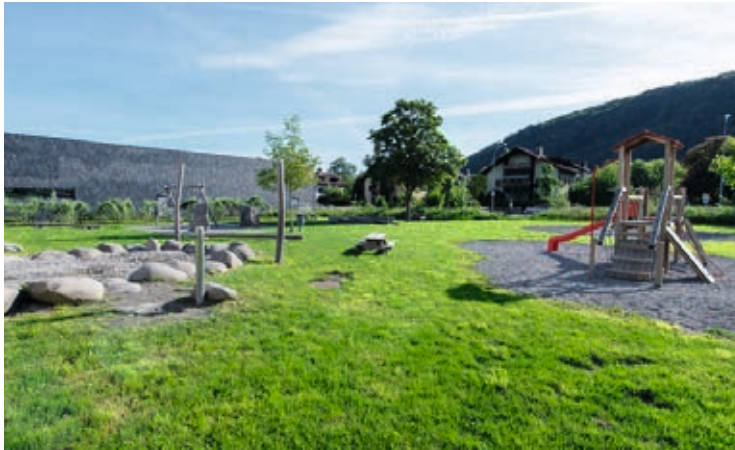
Waldbad Feldkirch →