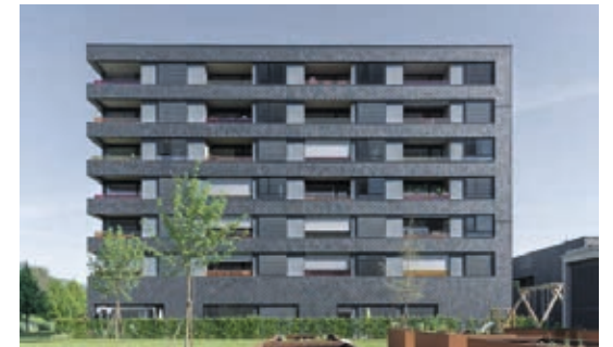
↓ Hämmerlestraße, Feldkirch

In allen Projekten, Geschäftsbeziehungen und Begegnungen unserer Mitarbeiter:innen mit Kund:innen und Partnern liegt Herzblut und Begeisterung für die Sache. Der persönliche Kontakt und der partnerschaftliche Umgang zu unseren Mieter:innen liegen uns sehr am Herzen. Überzeugen Sie sich selbst!