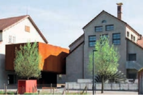
↑ Inatura, Dornbirn