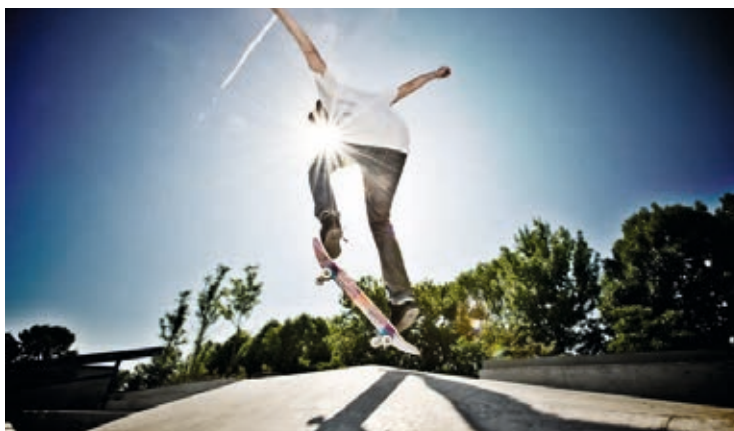
← Finnenbahn (links) und Skatepark Oberau