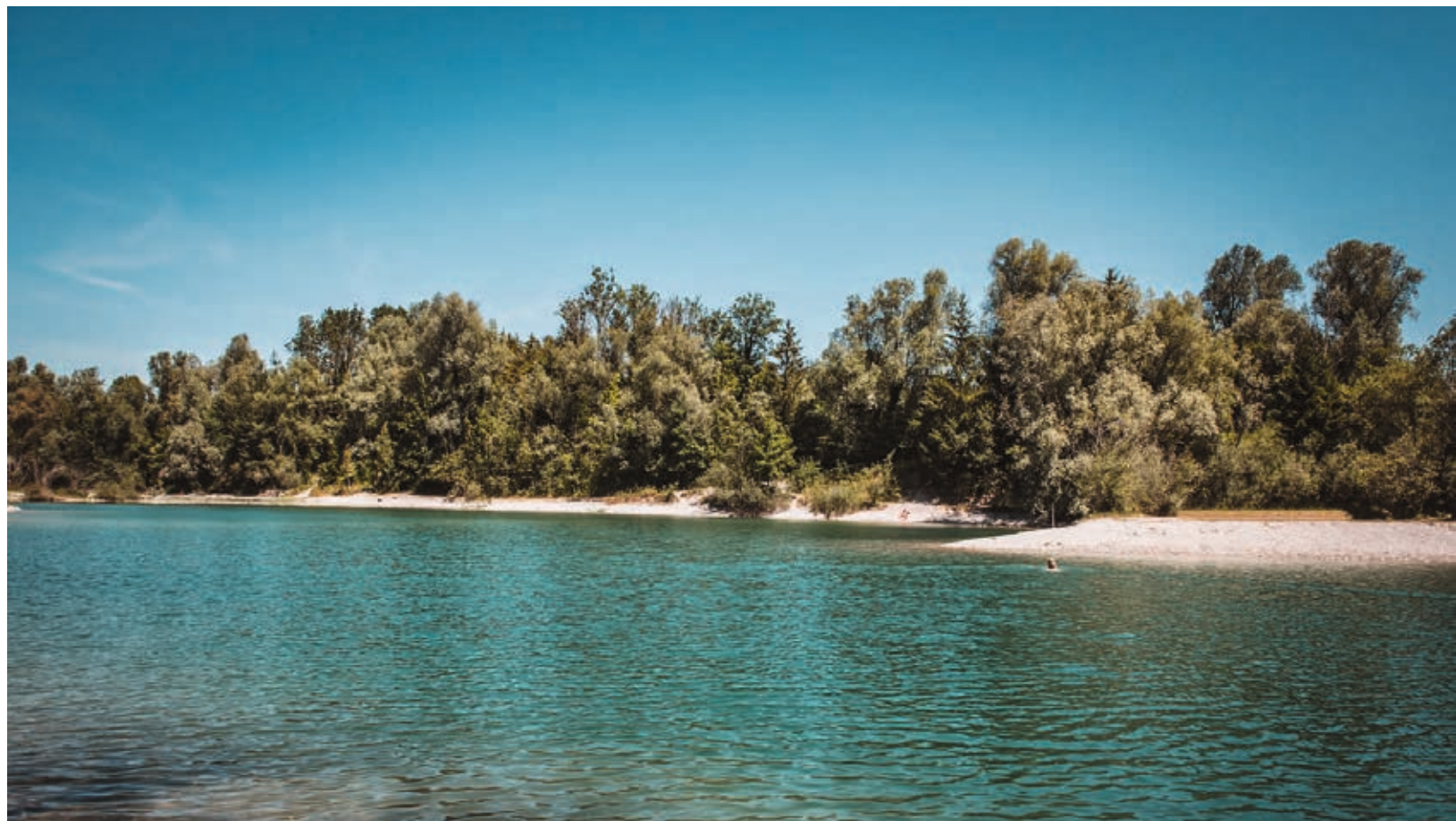
↑ Naturbadeseen Rüttenen (Baggerlöcher)