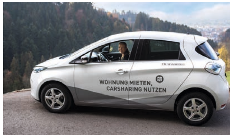
Caruso Carsharing →